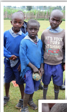
Tre skolegutter i Lessos.