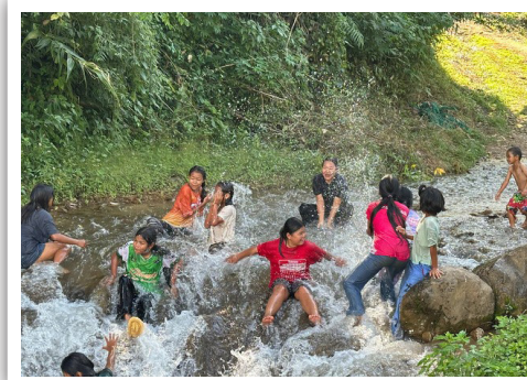
Badeliv og glede.