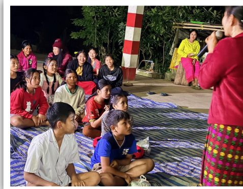
Barna på senteret følger godt med.