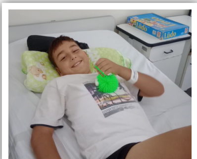
En takknemlig pasient som har fått besøk.